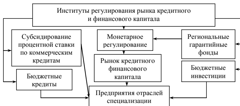
Рис.3. Институциональная система регулирования движения кредитного и финансового капитала

Стратегию банков нетрудно понять. Факторы неопределенности и риска высоки. Однако то, что при кредитовании предприятий за счет бюджетных средств весь риск распределяется между предприятием и государством, не совсем корректно. Было бы справедливо, если часть риска возьмет на себя кредитная организация. Но они отказываются от него полностью. Проблема кредитования должна стать предметом тщательного рассмотрения как на федеральном, так и на региональном уровне. Соответствующим институтам необходимо создать условия для предоставления гарантий кредиторам (рис. 3).