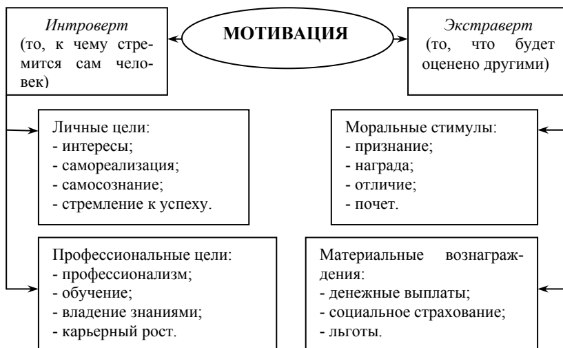
Классификация методов мотивации

формация трудовых ценностей, ухудшения социальной защиты, неадекватность цены рабочей силы – все это вызывает у людей чувство безразличия к своему профессиональному росту и требует переосмыслить вопрос эффективности существующих стимулов, начать поиск новых и разработать систему инновационной мотивации.