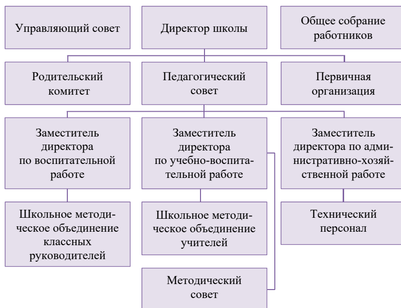
Рис. 1. Структура управления образовательной организацией

организационной структуры важным является создание научно-исследовательской базы, методических советов, практических семинаров, инновационных новшеств. Обучающиеся создают свои структуры: советы, комитеты, комиссии, секции, клубы и объединения. Возможно создание совместных структур и объединений. Программа и стратегия развития школы – это компетенции директора и педагогического совета, методическое и информационное обеспечение осуществляют школьные методические объединения (ШМО).