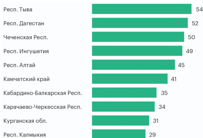
Рис. 2. Доля дотаций из федерального бюджета в доходах регионов-«лидеров», 2020 г., % от доходов (по материалам Министерства финансов Российской Федерации)

5. Большое количество субъектов федерации. Имеющаяся в России схема административно-территориального деления не отвечает требованиям реалий мирового развития. Она сформирована как очень громоздкая и «разношёрстная». Разнообразие статусов, ресурсной базы и финансового обеспечения создаёт условия для возникновения рисков.