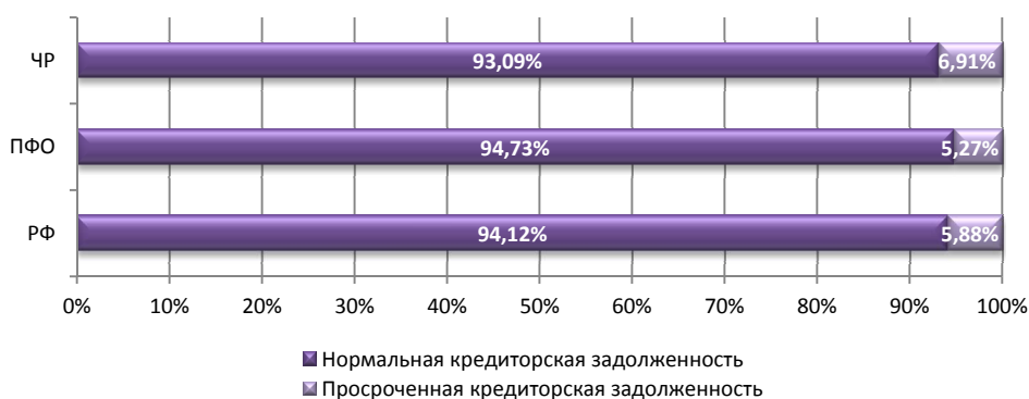
Рис. 1. Структура кредиторской задолженности в отраслях экономики в РФ, ПФО, ЧР в 2017 г.

Следует отметить, что около 7% всей кредиторской задолженности организаций ЧР является просроченной, а это, в свою очередь, неоспоримый признак глубокой неплатежеспособности.